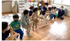
お友達がいっぱい♪