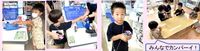
みんなでカンパニー！

設定活動の中で何度もおかいものごっこを行ってききましたが、ついにお外に出て、実際のお買い物へ！！今まで練習したことを思い出しながら、近くのサツドラへ行ってきました。ジュースを買うミッションだったのですが、道中から何味を買おうか、お金はどうやって渡すのかなどドキドキわくわくの子供たち◎お店ではお約束を守って、上手にお買い物をすることができました♪自分で買ったジュースはとても美味しかったようで、はもれびに帰ってきてから味わいながら飲んでいました◎