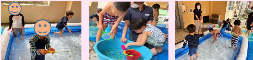
小学生も水遊びしたよ！