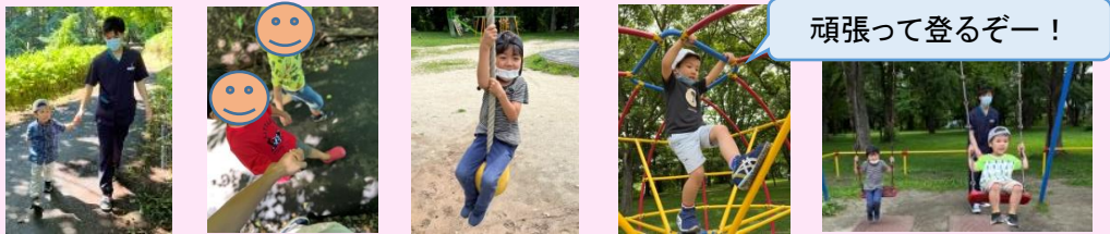
頑張って登るぞー！